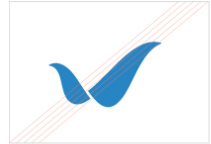
심벌마크의 비율을 왜곡한 경우