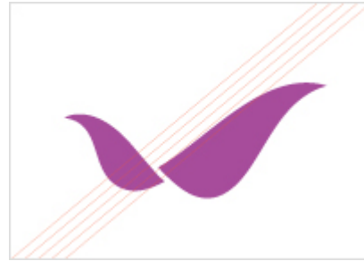
임의로 색상을 변경한 경우