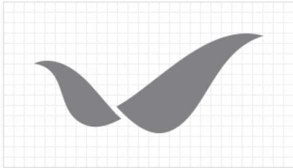
심벌마크 그리드 시스템