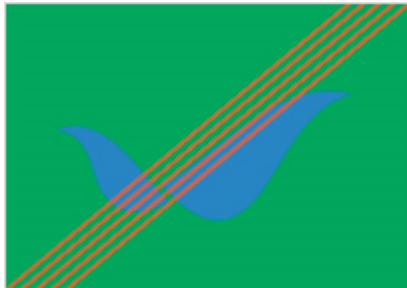
심벌마크에 테두리를 적용한 경우