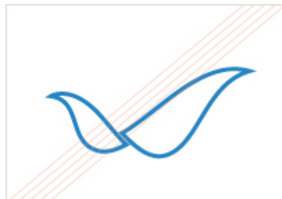
가독성이 떨어지는 배경위에 적용한 경우